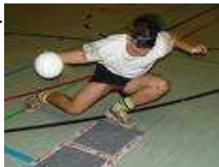
Un joueur de torball

Activités de démonstration lors du temps de midi : Baseball, Athlétisme (relais), Foot-fauteuil et tennis de table.